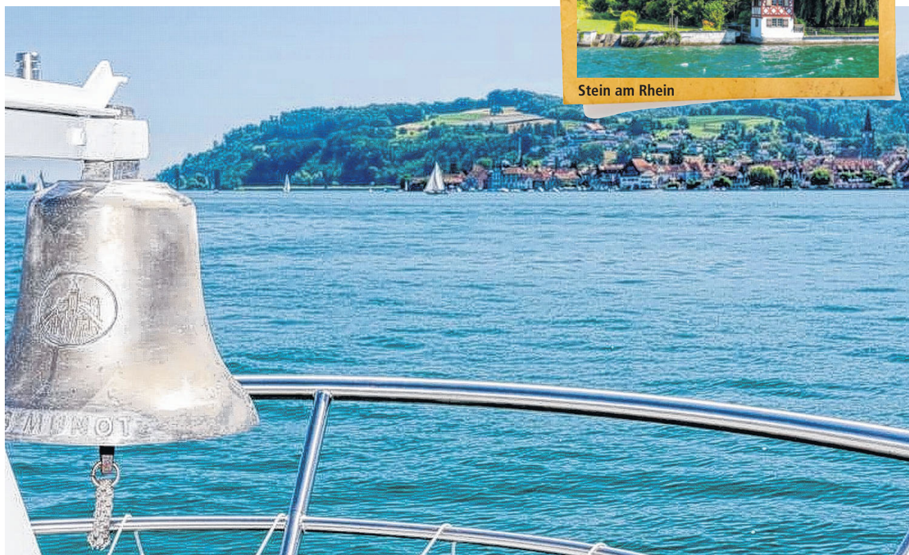
Stein am Rhein